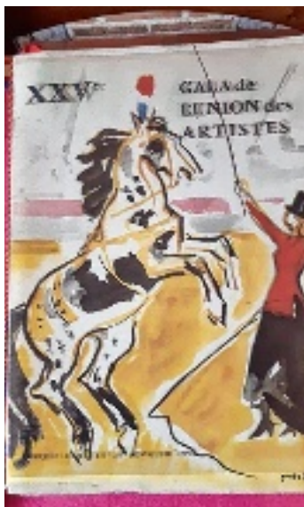
Le gala de l'Union des artistes, un spectacle qui perdure.

Un cheval cabré devant son dompteur sur la piste d'un cirque, tel est le programme que propose le livret de notre lectrice. Organisé au Cirque d'hiver à Paris, ce spectacle prend place dans un cadre spécial : celui du Gala de l'Union des artistes. Ce n'est pas le premier – mais le XXV e – et ce ne sera pas non plus le dernier, car aujourd'hui encore la tradition se poursuit. L'Union des artistes est une association fondée en 1917 par Félix Huguenet. Elle a pour but de proposer une entraide sociale aux artistes dramatiques, lyriques, chorégraphiques et de variétés. Pour perpétuer le soutien aux artistes les plus âgés dont les ressources sont coupées, l'idée est trouvée en 1923 par le comédien Max Dearly d'organiser des numéros de cirque. Les fonds perçus par la vente des billets sont ainsi reversés aux artistes les plus nécessiteux. Mais pour monter un tel événement, les plus grandes stars des arts du spectacle de l'époque se doivent d'y participer gracieusement : Annie Cordy en 1923 se fait dompteuse d'ours... tandis qu'en 1958, Jean Marais adopte la tenue de dresseur de chevaux. Les équidés sont aussi au rendez-vous de la XXV e édition comme en témoigne la couver-