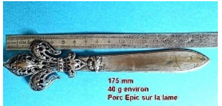
Le manche du coupe-papier de notre lecteur est ainsi formé de cet emblème millénaire, la fleur de lys.

Le manche du coupe-papier de notre lecteur est ainsi formé de cet emblème millénaire. La fleur de lys est traitée en ronde-bosse et ajourée de fleurons, enroulements et agrafes. Au niveau du talon de la lame est appliqué un ornement amusant : un porc-épic. Je ne vous apprendrai rien en vous disant qu'il est l'emblème du roi Louis XII, dont vous pouvez admirer une statue équestre à l'entrée du château de Blois ! Mesurant 17,5 centimètres de long, il semble malheureusement ne pas être en argent