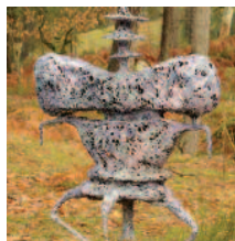
Chomo 101 peintures, sculptures et dessins