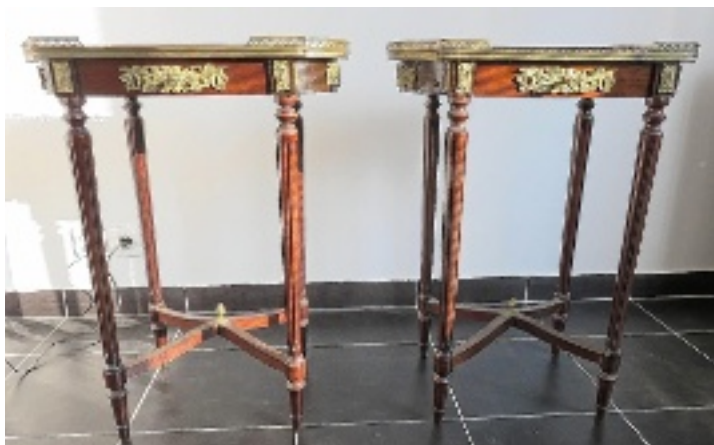
Une paire de tables typique d'un intérieur bourgeois du XIX e siècle.

Sur la paire de tables de Paul disposée à l'entrée en symétrie, on posait généralement ses gants, ou sa carte de visite sur un plateau d'argent, si l'on n'était pas un familier. Le dessus de ces tables ici en marqueterie richement ouvragée indiquait le rang du maître de maison : pas de couronne ni d'armoirie, nous sommes dans un salon bourgeois. Alternent fleurs épanouies dans un encadrement en bois clair de feuillages. Les couleurs vives sont obtenues en coloriant un bois tendre comme de la peinture -