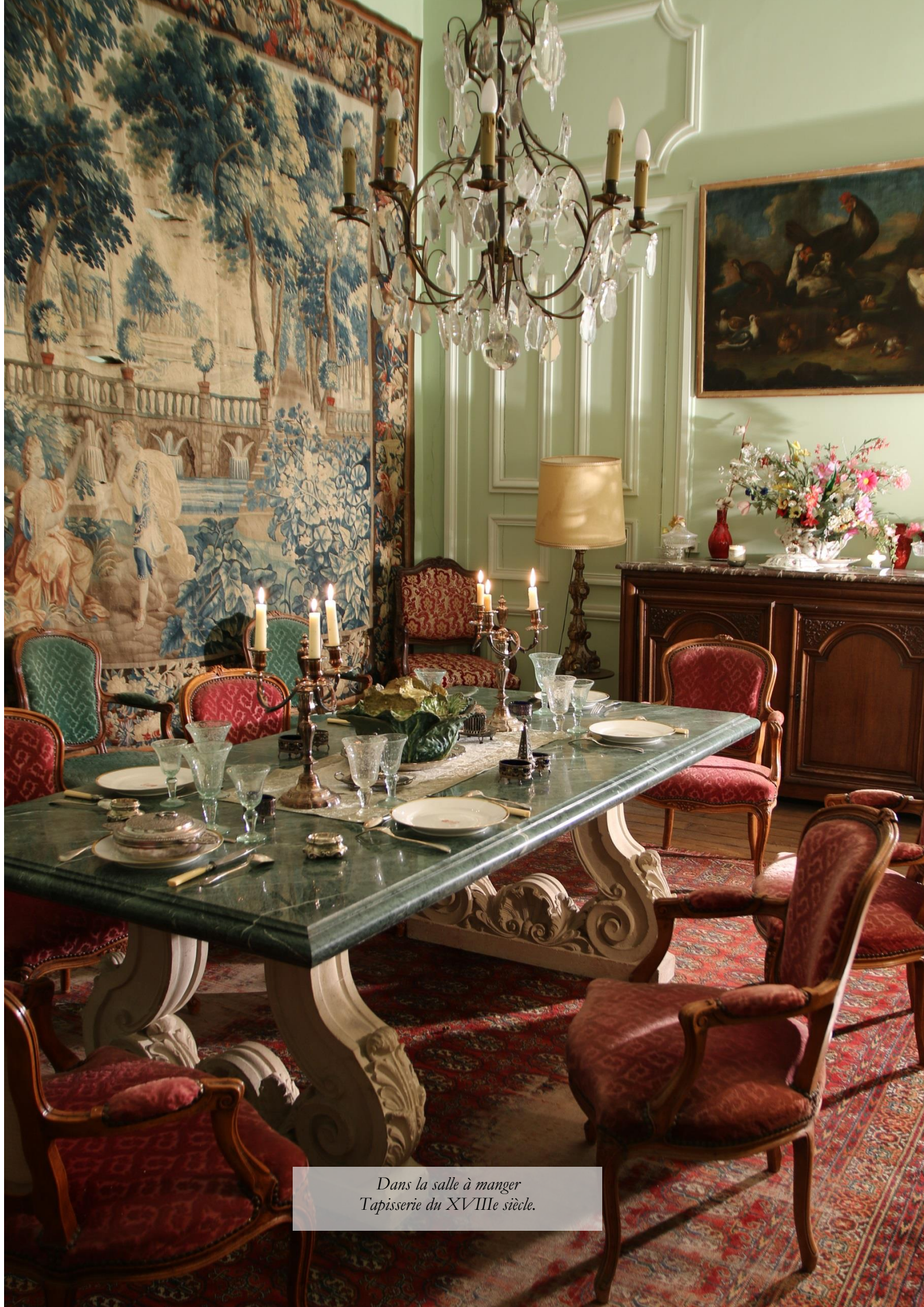
Dans la salle à manger Tapisserie du XVIII e siècle.