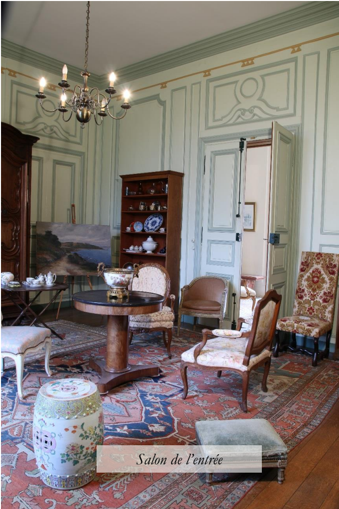
Salon de l'entrée