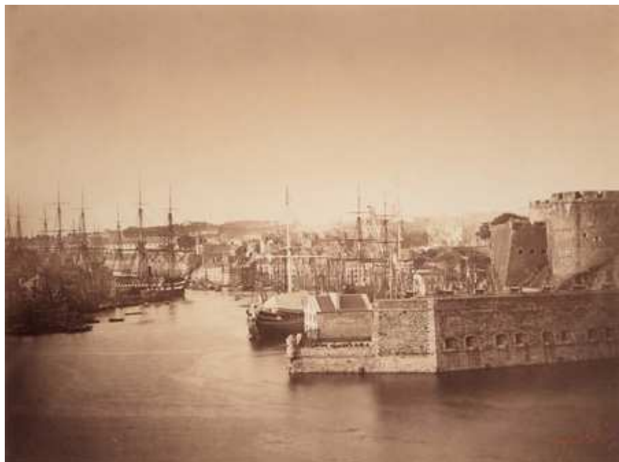
Entrée du port de Brest, 9-12 août 1858, par Gustave Le Gray. Adjugée 26 000 €. Acquisée par la Bibliothèque nationale de France, l'Institut national d'histoire de l'art et la Bibliothèque historique de la ville de Paris.