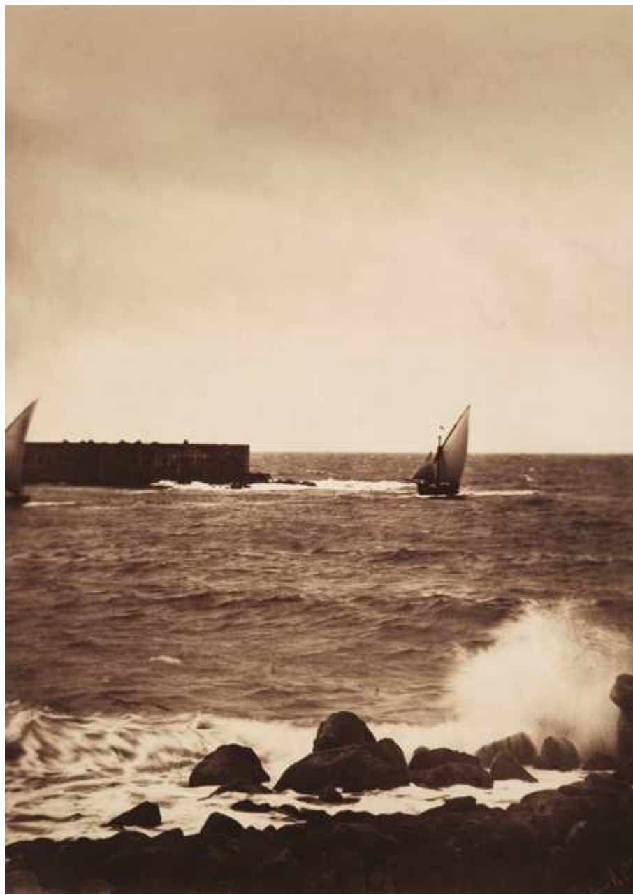
La vague brisée, [Sète] mer Méditerranée, 1857, par Gustave Le Gray. Adjugée : 300 000 €.

Circulez ! Y a tout à voir ! D'ailleurs, je pars... en vacances !