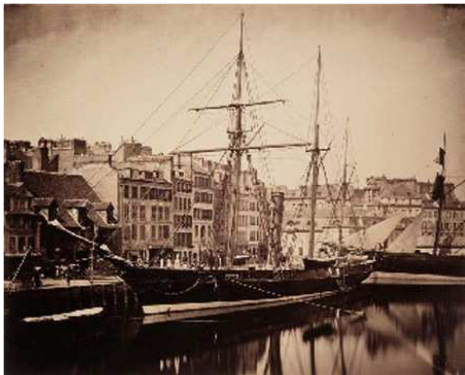
La Reine Hortense, Yacht de l'Empereur, Le Havre, 16 juin 1856, par Gustave le Gray. Adjugée 125 000 €.