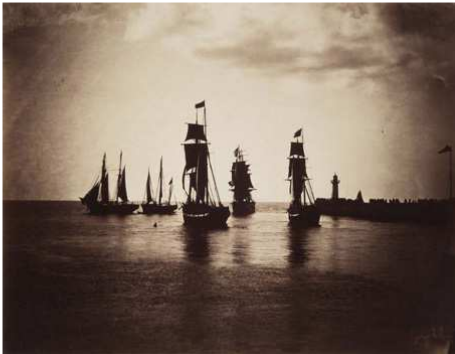
Bateaux quittant le port du Havre, 1856 ou 1857, par Gustave Le Gray. Adjugée 740 000 € hors frais.

Gustave Le Gray (1820-1884) a été révélé au grand public lors de la vente mémorable de Marie-Thérèse et André Jammes, en 1999, qui a vu le marché de la photographie décoller. Sa Grande Vague-Sète était partie pour 5 millions de francs. En mai 2011, la photo la plus chère au monde ( 2,76 millions d'euros) était vendue aux enchères chez Christie's. Le désormais célèbre Untitled # 96 , 1981, de Cindy Sherman, détrônait ainsi la photo d'Andreas Gursky, 99 Cent II Diptychon (2001) vendue 2,34 millions d'euros en 2007. Si le marché de la photographie contemporaine reste très soutenu, la valeur des œuvres du XIXe siècle peut également créer quelques surprises.