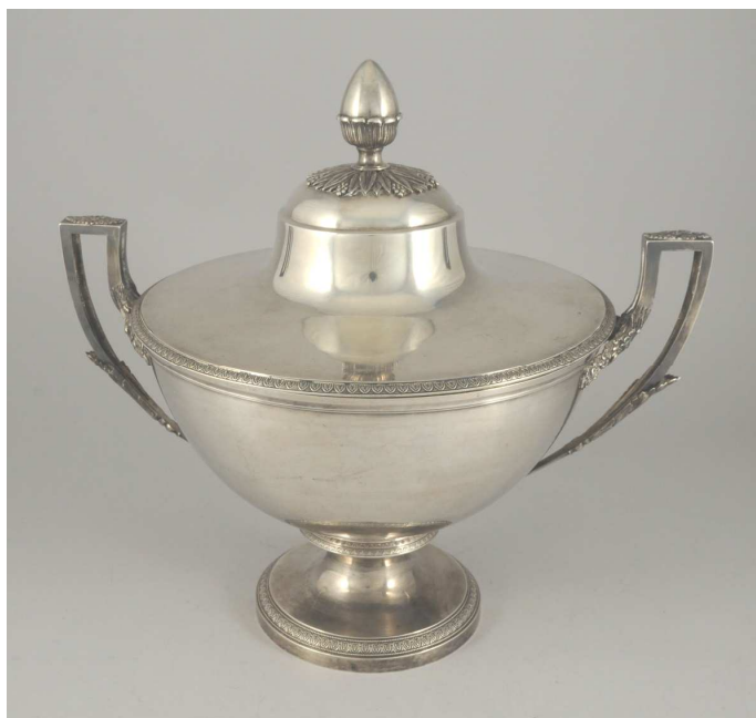
N°152 POT À OILLE de forme ronde en argent Poinçon 1er Coq, Paris 1798-1809. Maître-Orfèvre J, une tête de chien, G, R