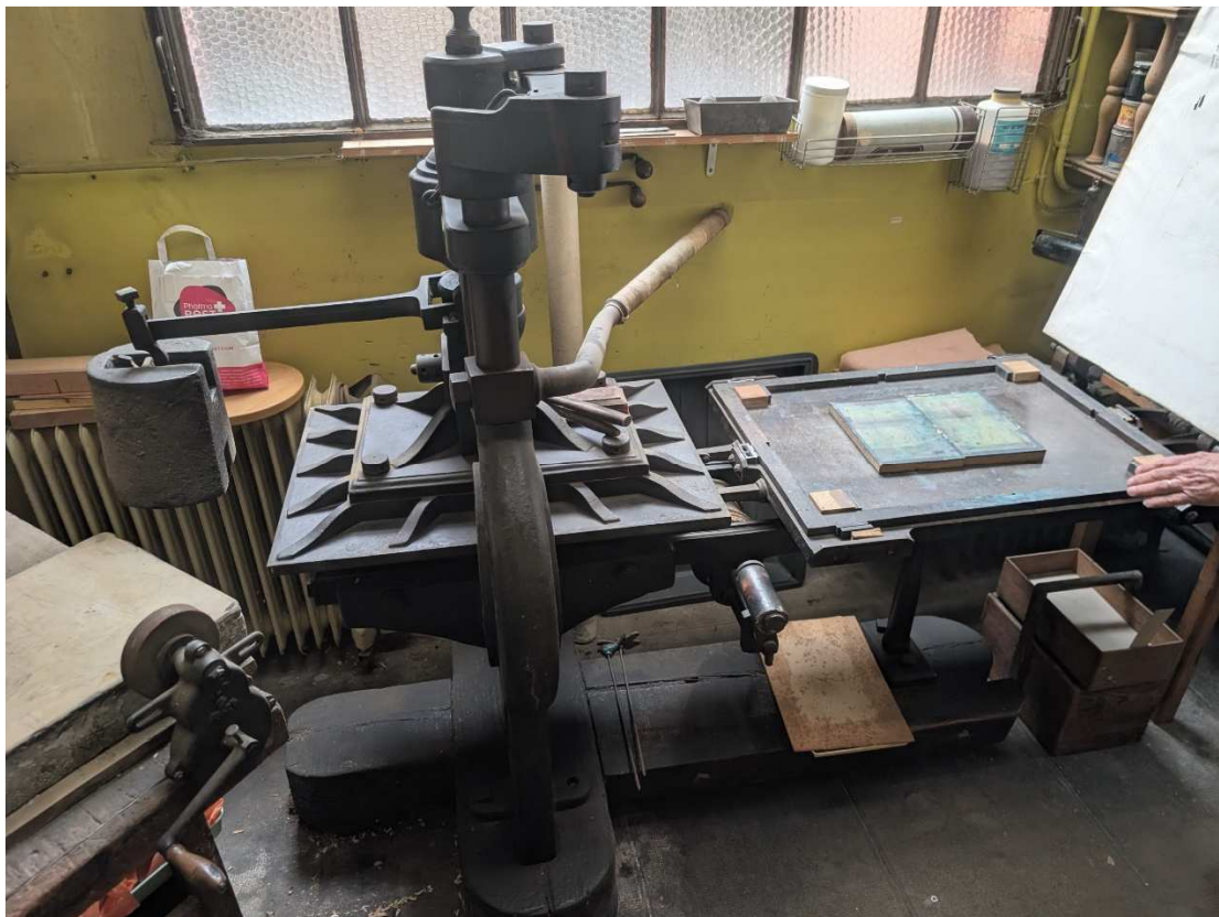
N°3 - Presse manuelle d'imprimeur-typographe, dite Stanhope, XIXe siècle

Exceptionnelle vente in situ du matériel d'un des derniers ateliers de pressiers d'art parisiens, Lepère, Beltrand, Blanchet, avant la vente du fond le 13 octobre 2026 à Vendôme