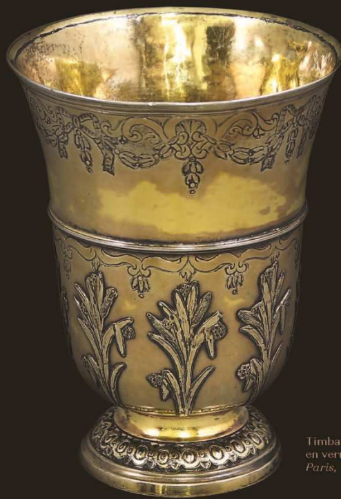
Timbale en vermeil, Paris, 1745-1746

Commissaires-Priseurs Experts près la Cour d'Appel