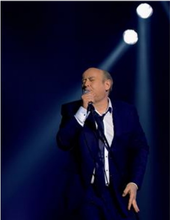
MICHEL JONASZ VENDREDI 30 JANVIER 2026