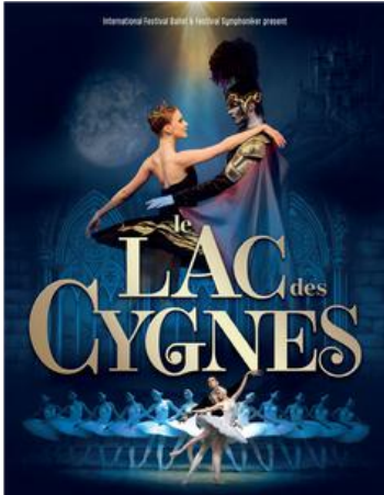
LE LAC DES CYGNES VENDREDI 24 AVRIL 2026