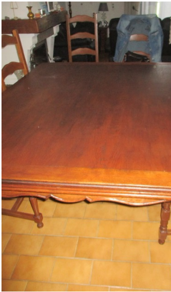
Cette table du 20 e siècle présente un décor de style Louis XV.

On le sait, beaucoup de choses se jouent à table. Ainsi, ce meuble touche autant dans l'histoire religieuse – la Cène par exemple, représentant l'ultime repas du Christ avec ses douze apôtres – que politique. C'est en ce sens, que certains concluent que « la politique est née à table ». Il n'est donc pas anodin qu'elle soit parée pour les réceptions officielles de nombreux artifices. Pensons par exemple au « surtout de cent couverts », commandé à Charles Christofle par le prince président Louis-Napoléon Bonaparte en 1852. Présenté à l'Exposition universelle de Paris trois ans plus tard, il est destiné à orner une table de 30 mè-