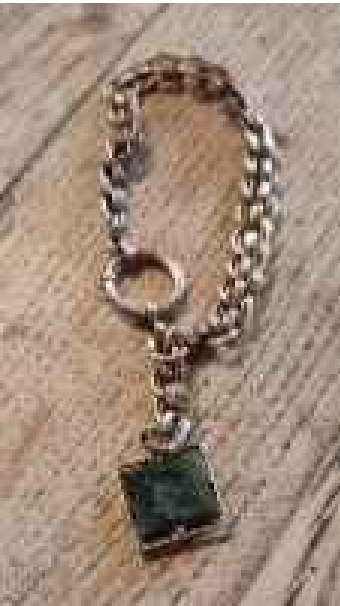
Un bracelet à mailles composées d'anneaux entremêlés.

L'objet de cette semaine est justement un bijou : un bracelet à mailles dites « forçat », composées d'anneaux entremêlés. On note également la présence d'une breloque pendante ornée d'une gemme — c'est-à-dire une pierre plus ou moins précieuse (ou une matière dure imitant la pierre) — sertie dans une monture métallique. On parle alors de bracelet à breloque ou à pendeloque. Ce type de bracelet est particu-